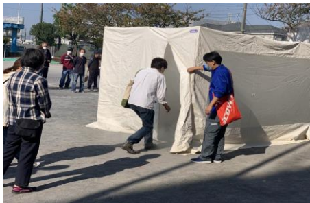
煙からの脱出体験