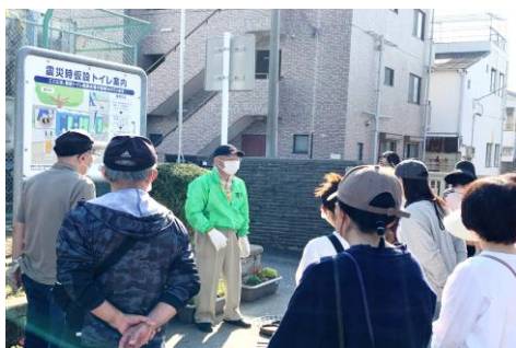
簡易トイレ組立訓練